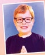
Lieve Paus Franciscus,